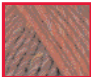
8906 Cinnamon Twist