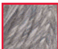
8911 Blue Heather