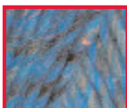
8917 Indigo Run